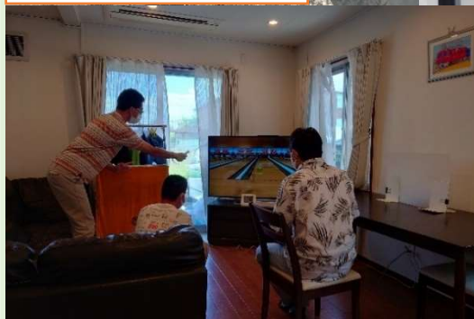
共同生活援助事業所 ともしにーホーム