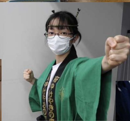
就労移行支援事業所 就労定着支援事業所 ポートビズ