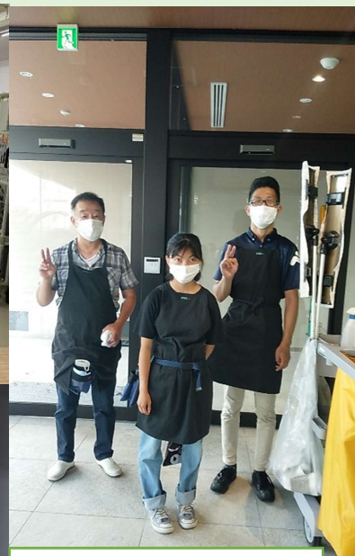
就労継続支援A型事業所 ともしにー