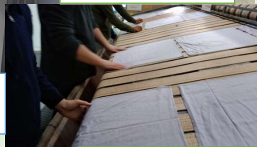
就労継続支援A型事業所 ステップアップともしにー